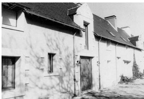
Le Château de Porterie derrière lequel on a retrouvé des vestiges plus anciens.

défensif, serait-il à l'origine de ce nom de "Porterie" auquel jusqu'à présent on n'a pas réussi à trouver une étymologie valable ? Qui sait !