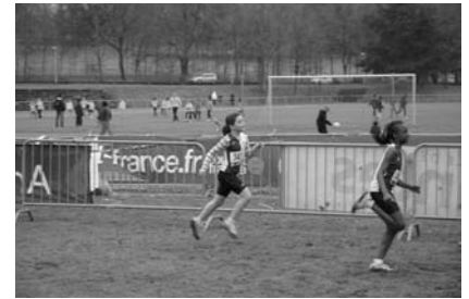
▲ Cross Dervallières 18-01-2009