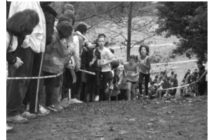
▼ Cross départemental Poussines Ambre Oréal