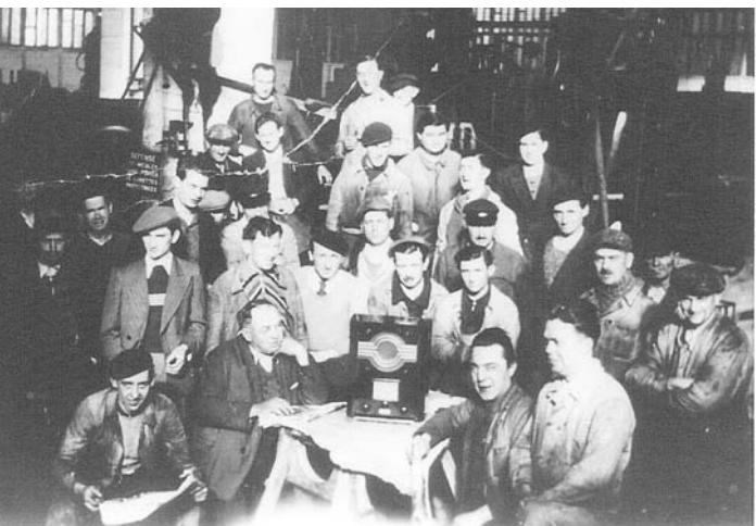
Batignolles 1936 - L'usine occupée.

La municipalité d'Auguste Pageot soutient le mouvement , les restaurants municipaux participent au ravitaillement en livrant des repas chauds. "C'est ainsi qu'hier [...] de superbes biftecks noyés dans de succulents haricots fumaient dans les assiettes, alors qu'un quartier de fromage complétait le repas", salive le